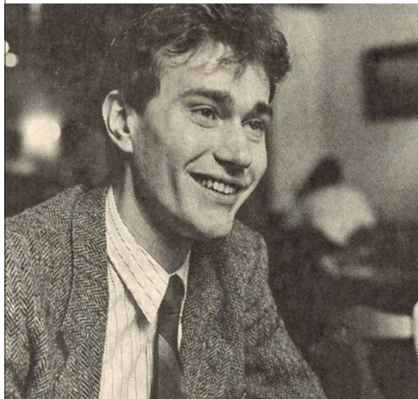
Het Economisch Alternatief van de SP in 1983 roept warme herinneringen op.

Hun terugblik op de geschiedenis van het 'Economische Alternatief' van de SP roept warme herinneringen op. Samen met generatiegenoten in onze studiedienst, met Louis Tobback, Norbert De Batselier en Freddy Willockx heb ik toen een stevige campagne opgezet in de interne keuken